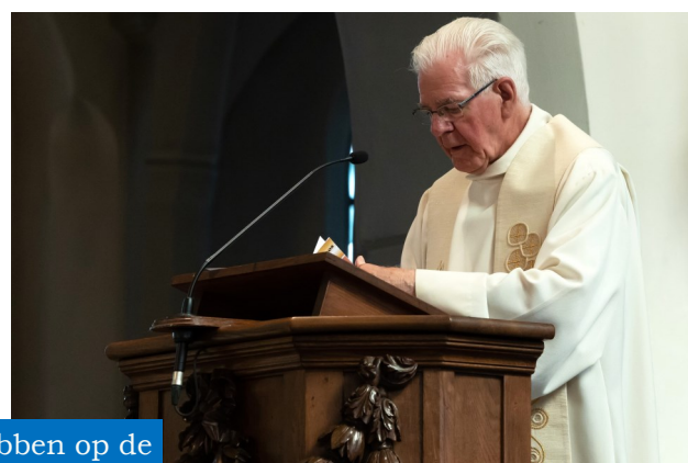
Foto's welke betrekking hebben op de Jubileummis 50 jaar DuBOS.