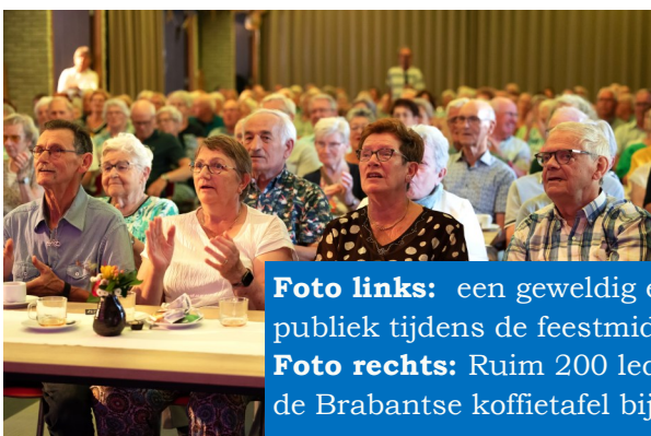
Foto links: een geweldig enthousiast publiek tijdens de feestmiddag in Litsberg. Foto rechts: Ruim 200 leden genieten van de Brabantse koffietafel bij Boer Goossens.